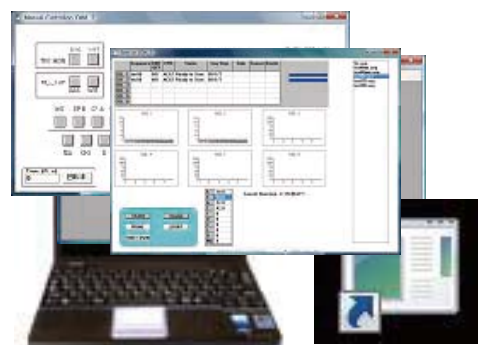
Hシリーズ合成機コントロールソフト

日本テクノサービス㈱のDNA/RNA合成機はDNA合成、RNA合成、修飾塩基などのさまざまなDNA合成、RNA合成の広範囲なアプリケーションに適した高品質な合成をする為の合成機です。